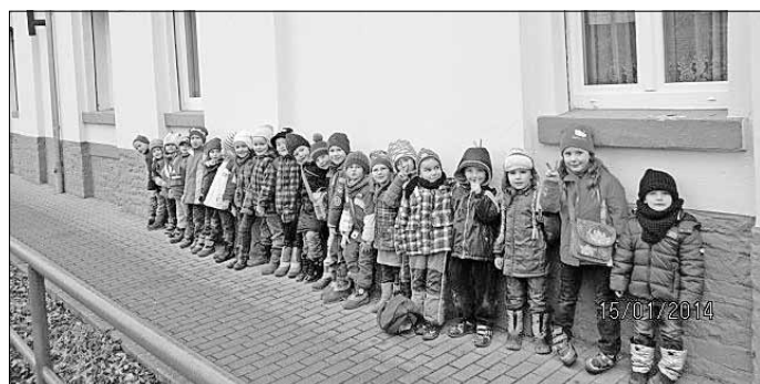
Kinder vor der Turnhalle

Mit Sport- und bewegungsorientierten Angeboten in unserer Kindertagesstätte unterstützen wir in vielfältiger Weise die sprachliche, intellektuelle und körperliche Entwicklung der uns anvertrauten Kinder. Sie leisten außerdem einen wichtigen Beitrag zur Überwindung sozialer Schranken und zur Integration benachteiligter Kinder. In den täglichen Angeboten des spielerischen Lernens stehen der Wechsel von Bewegung und Ruhe im Vordergrund. Das wirkt ausgleichend und fördert Konzentration und Kreativität. Deshalb verbringen die Kinder der großen Gruppe, der Vorschulgruppe, jeden Mittwoch ihren Sport-Tag in der Leimbacher Turnhalle am Pochwerk.