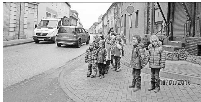
Kinder wollen die Straße überqueren

Bis dorthin ist es, für die Knirpse, ein sehr weiter Weg durch die Straßen unserer Stadt. Zum Überqueren der B 86, mit ihren sehr hohen Verkehrsaufkommen, beweisen die Kinder jede Woche, wie sicher sie, durch eine gute Verkehrserziehung, diese Situation meistern.