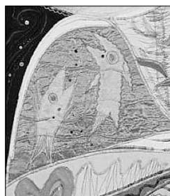
Detail des Wandteppichs „Münchhausen“ von Fredericke Happach, 1973