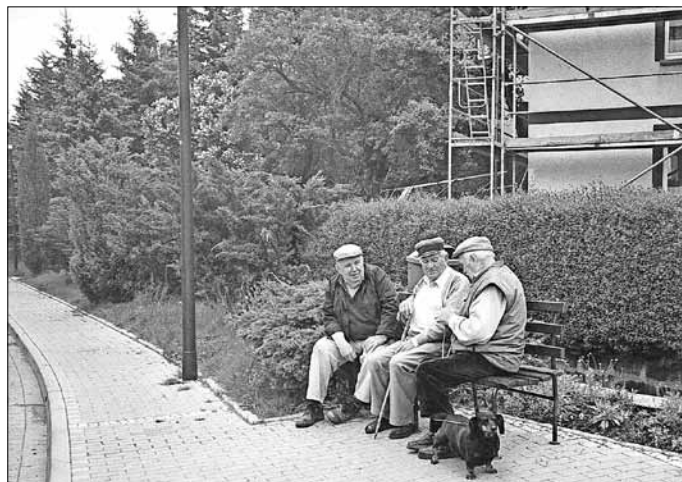
Kleiner Plausch auf der Dorfbank

Oft gibt es besondere Programme und Gäste sind herzlich willkommen: am 17. Dezember Weihnachtsausflug nach Biesenrode im Jahr 2014 planen wir wieder einen Vortrag mit Herrn Uwe Sterze, der uns Bilder aus Vatterodes Vergangenheit zeigen wird.