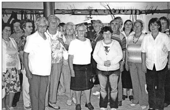
Ausflug nach Deetfurt