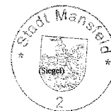
Bürgermeister der Stadt Mansfeld