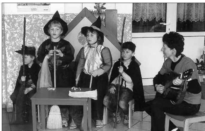
Kinder der Kita „Gänseblümchen“ führen ein Hexenspiel im AWO Ortsverein Vatterode auf

Alt und Jung trafen sich kürzlich im AWO Ortsverein Vatterode.