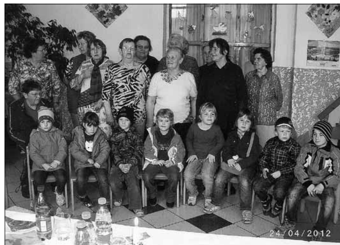
AWO Ortsverein Vatterode und Kinder der Kita „Gänseblümchen“

Die Vorschulkinder der Kita „Gänseblümchen“ führten ein Hexenspiel auf, was großen Anklang bei den Mitgliedern der AWO fand.