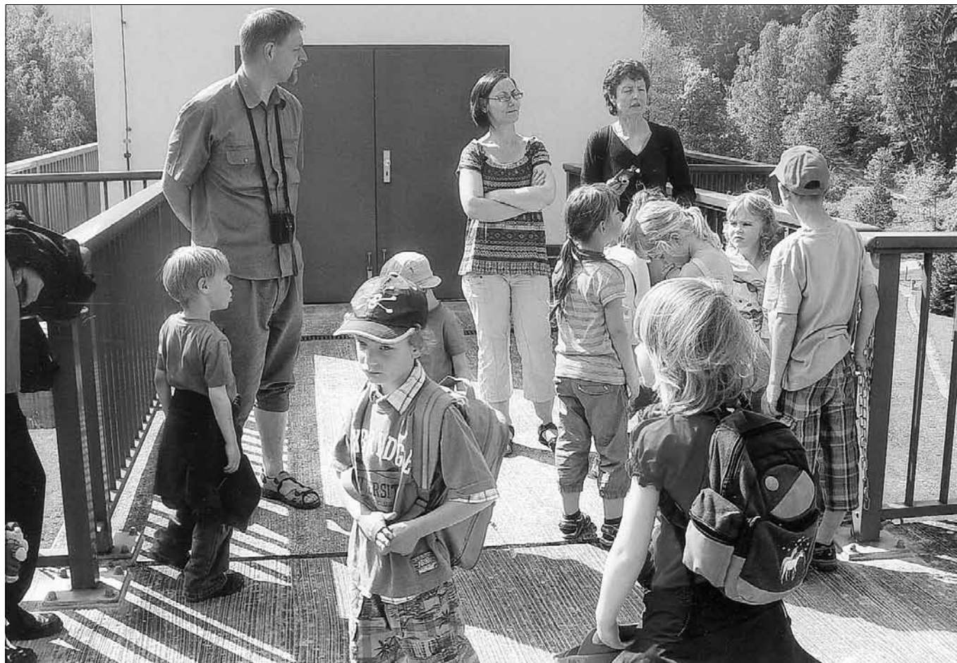
Eine interessante Kremsertour zur Wippertalsperre unternahmen die Kinder der Kita Vatterode