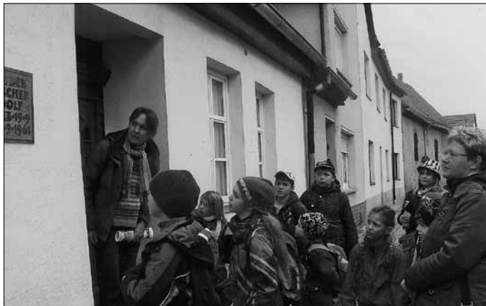
Vor dem Spenglerhaus